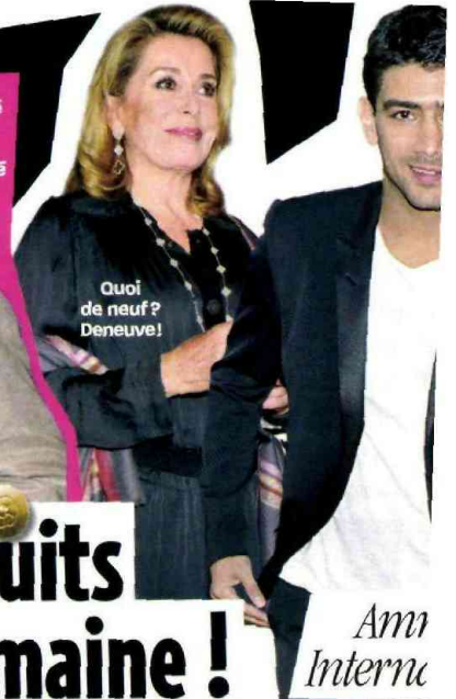
Quoi de neuf? Deneuve!